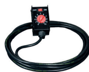
Optional REMOTE CONTROL